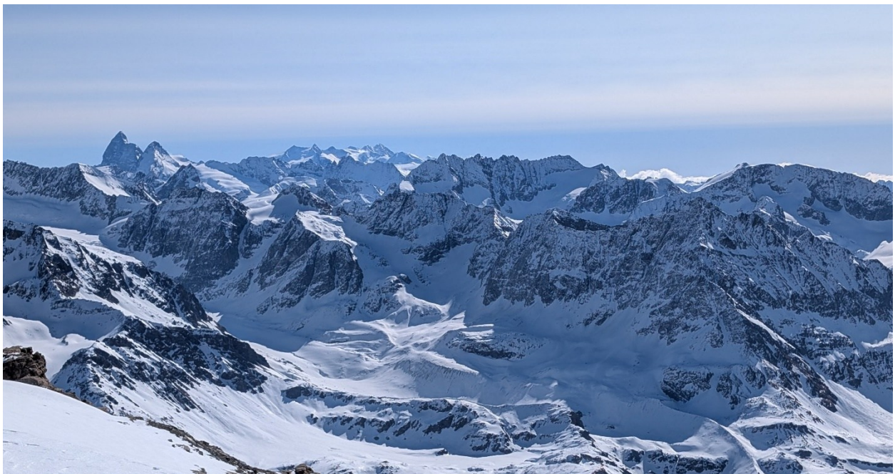
La vista spazia fino alla fine dell'avventura: il Cervino