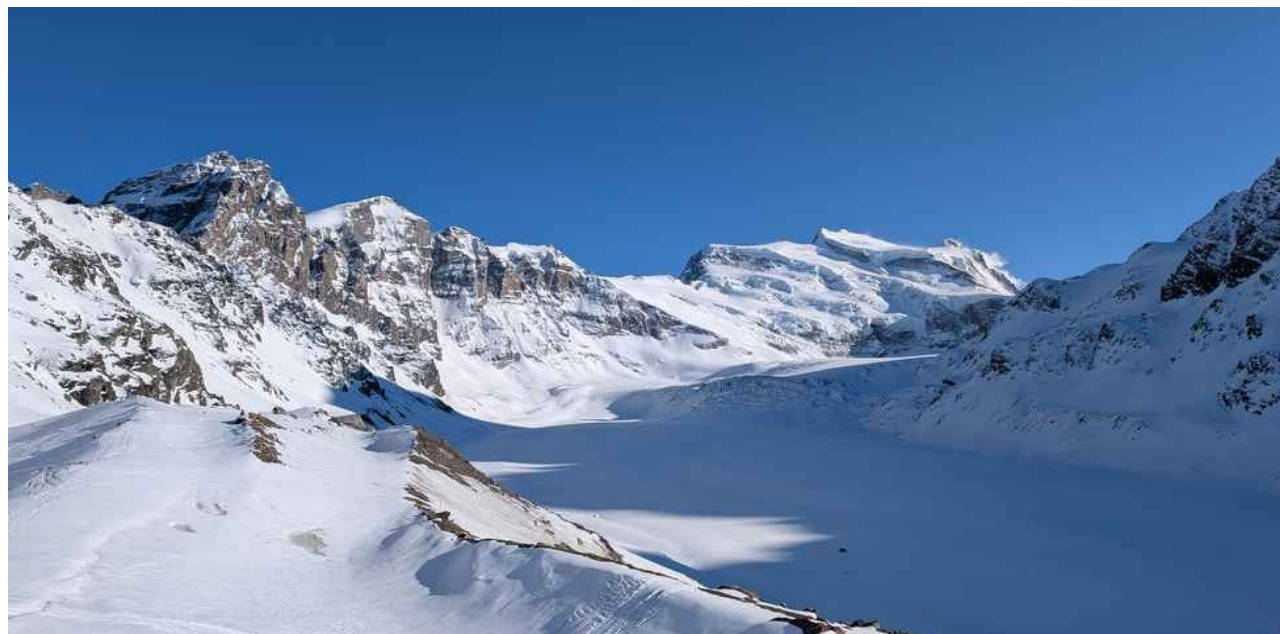
Dalla Cabane FXB Panossière il gruppo del Gran Combin

Con la discesa a Champex Lac ed il taxi fino a Mayenne du Revers ci siamo spostati il giorno successivo alla Cabane FXB Panossière alla ricerca di un passaggio poco frequentato ma stupendo, dove anche l'autista del taxi spiegandoci il suo lavoro per incastrare i giusti intervalli al fine di trasportare avventurieri come noi ci confermava che poche persone scelgono questo itinerario.