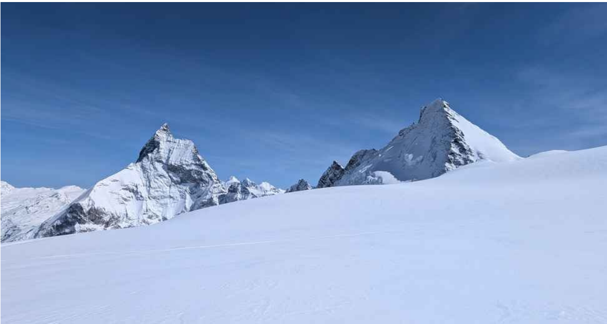
Cervino e Dent d'Herens dal Col de Valpelline