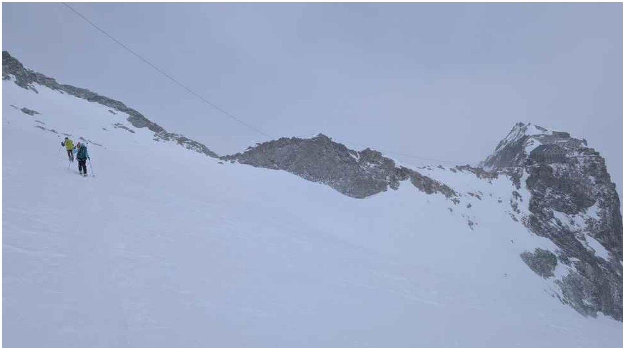
L'arrivo alla Cabane des Vignettes