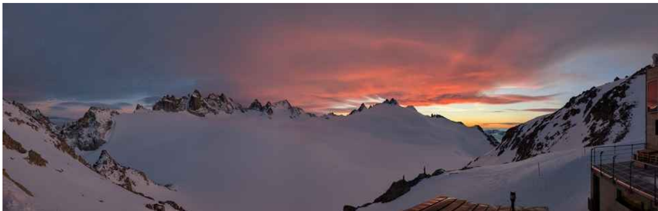
Dalla Cabane de Triant a dominare l'omonimo ghiacciaio

Siamo arrivati la seconda sera alla Cabane du Trient attraverso il Col du Passon (che si trova prima del Col du Chardonnet partendo dal paese) e il Col Superiour du Tour.