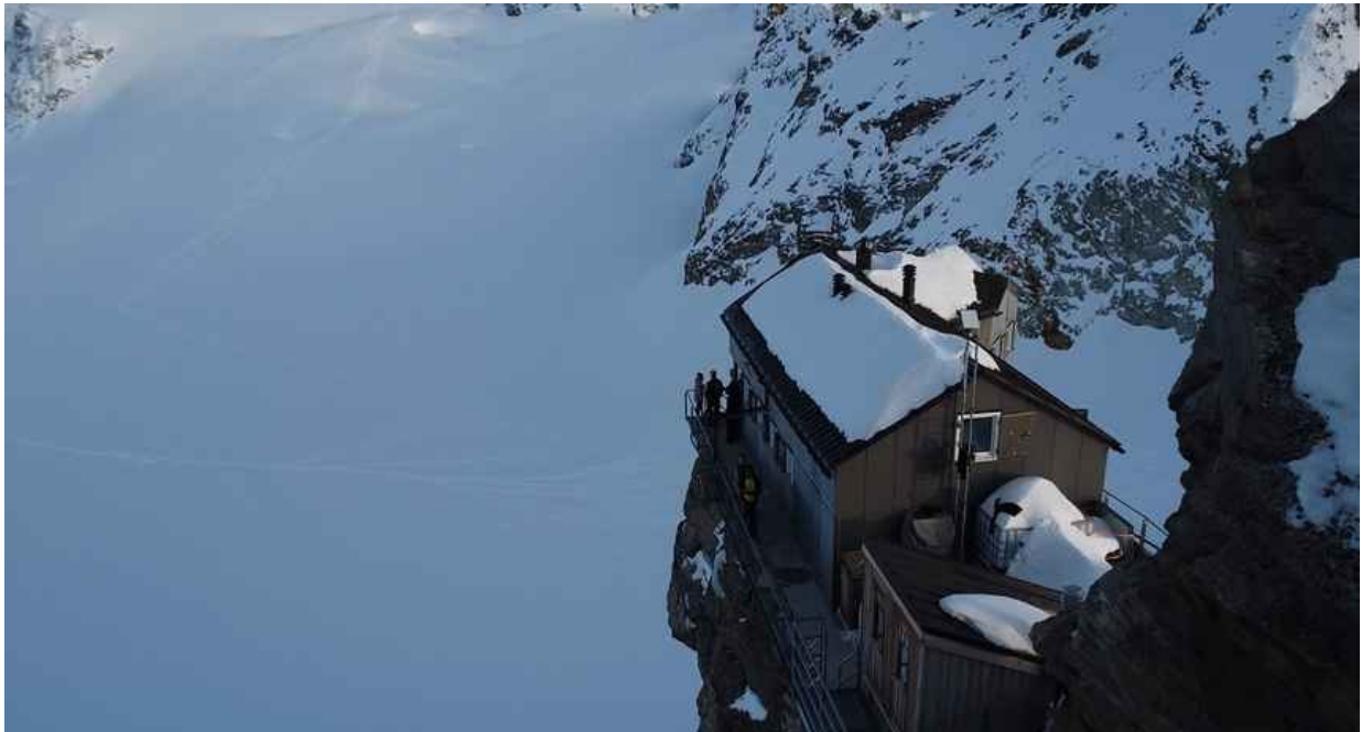
La Cabane de Bertol, come un nido d'aquila

Alcuni rifugi erano più accoglienti, altri spartani, spesso senza acqua di fusione per lavarsi. Ma ogni arrivo è stato un traguardo. Sempre lo stupore di un'alba o di un tramonto ci ha lasciati senza parole.