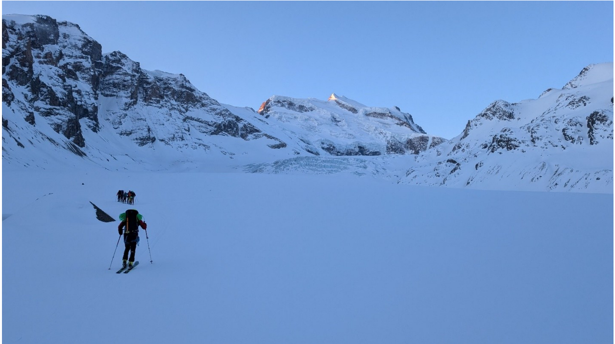
Verso Il Tournelon Blanc

La salita al Tournelon Blanc ma soprattutto la discesa verso la vallata per la Cabane de Chanrion il quarto giorno, ci hanno messo alla prova nella ricerca della giusta traccia, e qui ci siamo avvalsi anche del drone (a proposito di nuove tecnologie) per evitare di sbagliare l'intricato passaggio in discesa verso Le Jardin des Chamois.