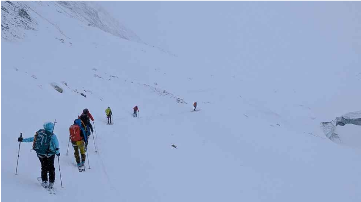
La tempesta sul ghiacciaio D'Otemma

Arrivati al rifugio, abbiamo dovuto rivedere i piani e l'itinerario programmato. Le condizioni meteorologiche sono inaspettatamente e repentinamente cambiate e per raggiungere in sicurezza la Cabane des Vignettes, abbiamo optato nel quinto giorno per la lunga risalita attraverso il ghiacciaio d'Otemma, evitando (con dispiacere) la salita alla Pigne d'Arolla.