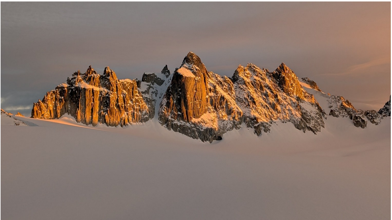
La Bec de Triant al tramonto

Il tracciato scelto non è tecnicamente estremo, ma è reso impegnativo dal peso dello zaino, che aumenta ancora di più quando si ha il turno di portare la corda. Ogni passo è misurato, ogni gesto dosato, ogni grammo di energia conservato.