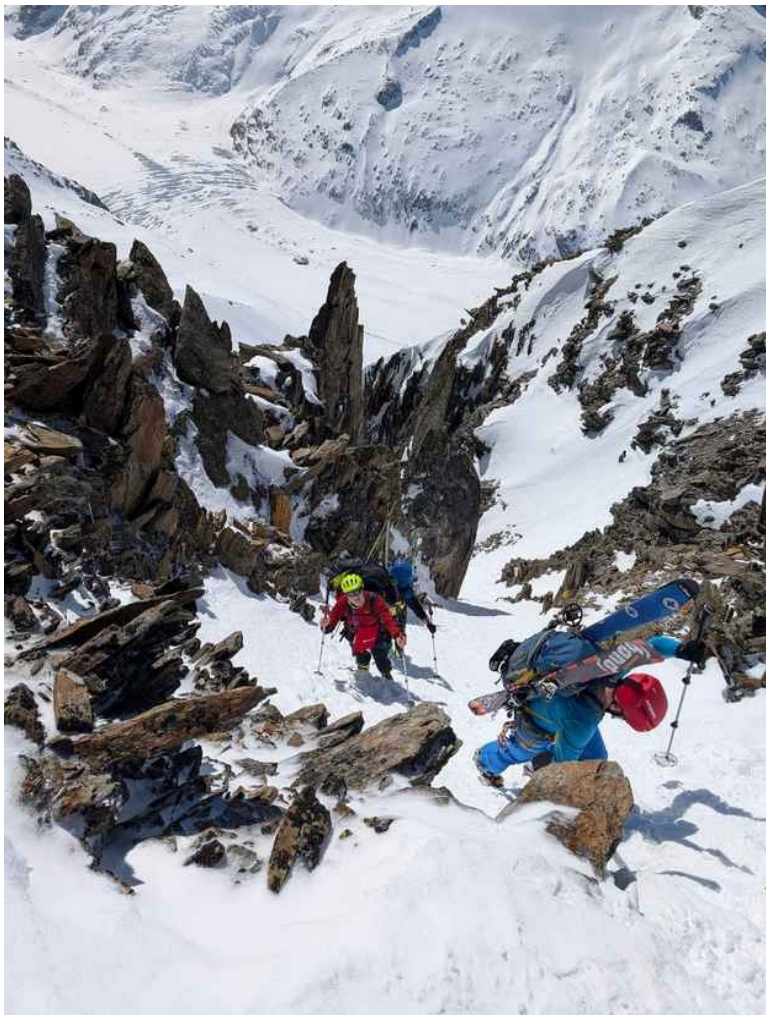
L'uscita del canale al Col du Passon

All'uscita dal rifugio, i primi passi erano sempre i più duri: i muscoli ancora intorpiditi, il freddo mordente e la prospettiva di affrontare un'intera dura giornata di cammino.