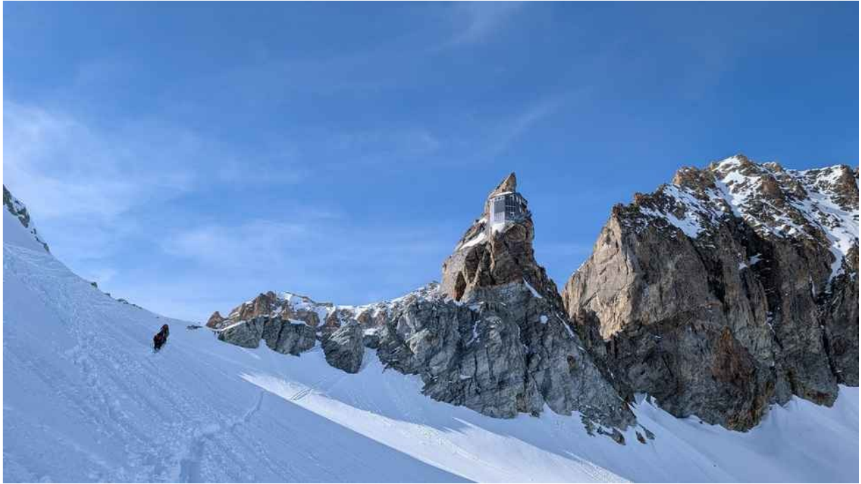
L'arrivo alla sorprendente Cabane de Bertol