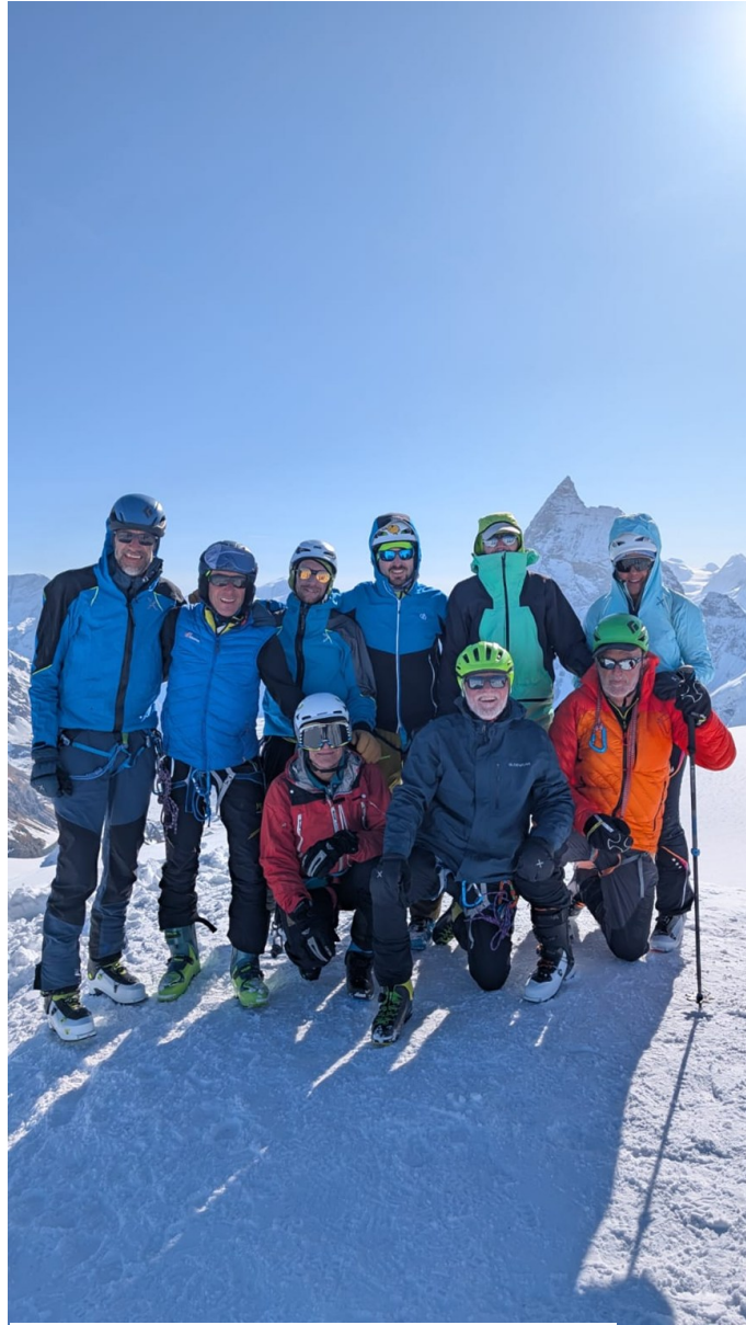
Sulla vetta della Tête Blanche