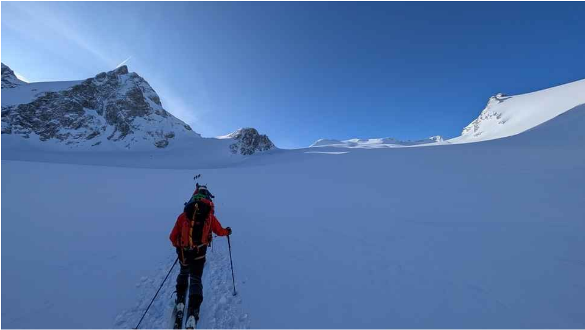
Verso il Col de L'Evêque

Il penultimo giorno la pianificazione fatta a casa ci avrebbe fatto scendere dal Ghiacciaio alto di Arolla verso il canale che sale alla Cabane de Bertol, ma la neve caduta durante la notte e lo scoppio improvviso di una carica per mettere in sicurezza altri pendii, al Col de l'Evêque ci hanno fatto prendere la decisione di tenere la direzione di Zermatt fino al col de la Tête Blanche, per poi dirigerci in sicurezza fino al rifugio. Grazie a questa variante abbiamo incrociato il Team femminile Alpinequest ( www.alpinequest.org ) al Col du Mont Brulé e qui ci siamo confrontati con lo SkiAlp descritto da Crovella nel suo articolo dello Zaino n. 20, ma declinato su varie giornate di spostamento. Un'altra dimensione!