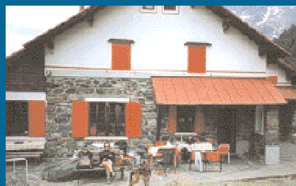
Rifugio GERLI-PORRO 1.960 mslm

In Valmalenco, alle pendici del "Ghiacciaio della Ventina"