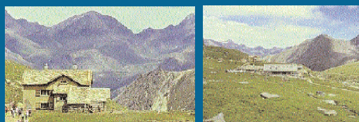
Rifugio VITTORIO SELLA 2.585 mslm

Nella Valle di Cogne, alle pendici del Gran Paradiso